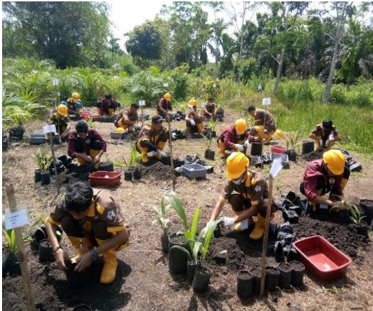
Gambar 2. Peserta mempersiapkan media tanam

dikehendaki peserta uji (asesi) [12]. Pendampingan baik sesi teori ataupun praktek.