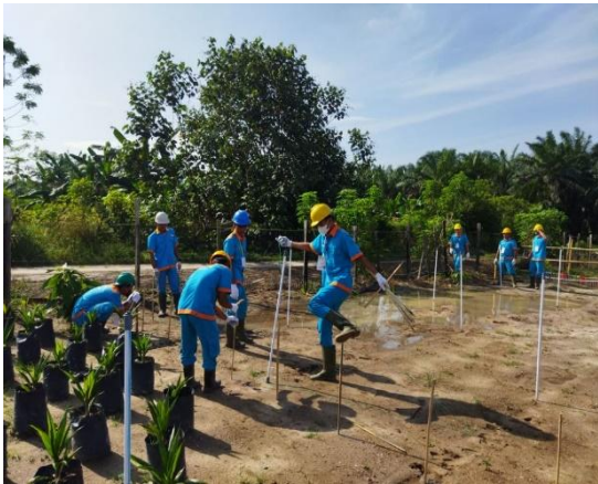
Gambar 3. Peserta Menyiapkan Titik Tanam

Pada tatap muka pertama kali dalam kegiatan pelatihan ini, tim dosen memberikan motivasi kepada siswa dan materi tentang skema pembibitan tanaman kelapa sawit [13], [14]. Kemudian pada hari-hari berikutnya siswa diberikan praktek yang berkaitan dengan kebutuhan kompetensi keahlian mereka untuk mempersiapkan diri menghadapi ujian kompetensi [15], [16].