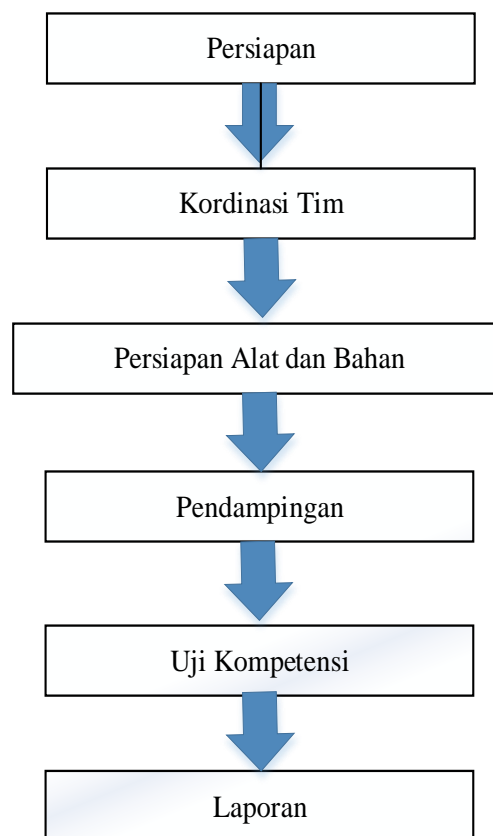
Gambar 1. Pendampingan Uji Kompetensi HASIL DAN PEMBAHASAN

Kegiatan pengabdian masyarakat dilaksanakan dari tanggal 26 Febuari sampai dengan 5 Maret 2022 lokasi di SMKN 1 Seberida Kabupaten Indragiri Hulu. Pendampingan diberikan untuk siswa kelas 12 sejumlah 92 orang diakhiri dengan uji kompetensi skema pengelola pembibitan kelapa sawit.