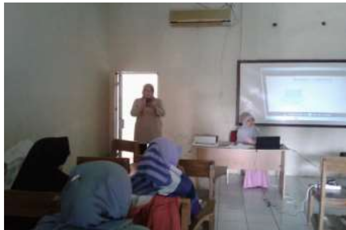
Gambar 1. Penyuluhan yang Diberikan Tim Pengmas kepada Guru SMP di Cilamaya

Di bawah ini adalah uraian dari kegiatan pengabdian masyarakat yang dilaksanakan oleh tim pada Guru SMP di Cilinaya.