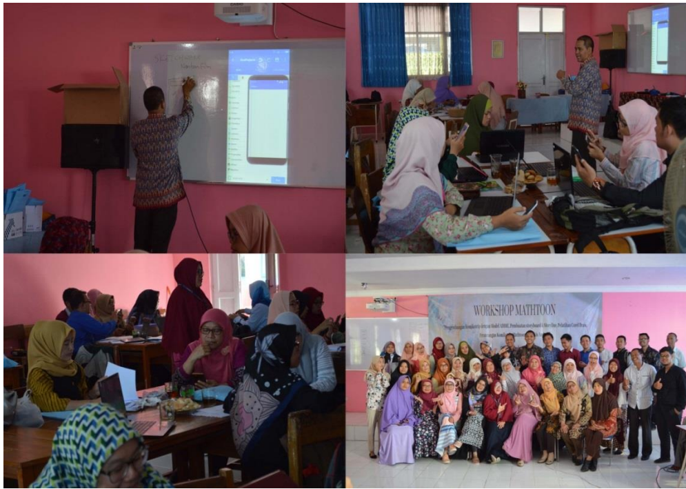
Gambar 2. Pelatihan Aplikasi Sketchware Berbasis Android