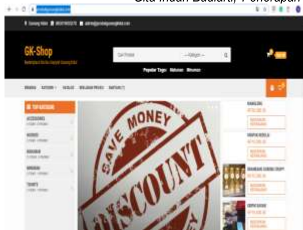
Gambar 1. Tampilan website pemasaran.