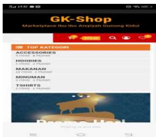
Gambar 2. tampilan aplikasi pemasaran produk ibu-ibu Aisyiyah Gunung Kidul.

Pelatihan ini merupakan sesi kedua dari pembuatan website . Setelah website jadi peserta diminta untuk menggunakannya. Narasumber pelatihan ini adalah Murrein Miksa M, S.T., M.T dan Ahmad Azhari, S.Kom., M.Eng. Kegiatan ini dimulai dengan mengajari peserta untuk membuat akun sebagai pembeli. Kemudian, peserta diajari untuk membuat akun penjual. Setelah itu peserta diminta mengunggah foto produk. Peserta juga bisa melihat berapa orang yang sudah membeli menggunakan akun tersebut.