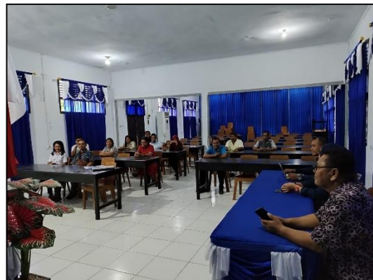
Gambar 3. Pelaksanaan Kegiatan