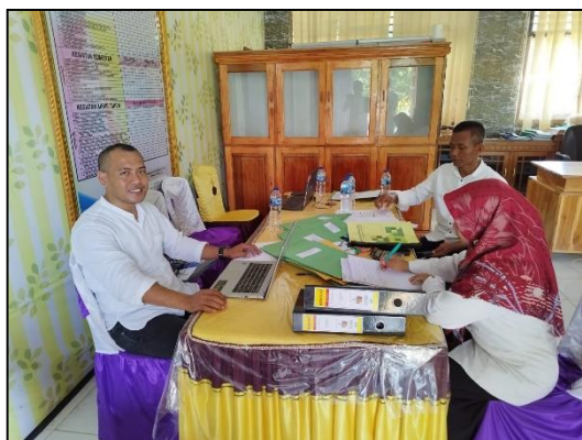
Gambar 2. Observasi Awal Kegiatan