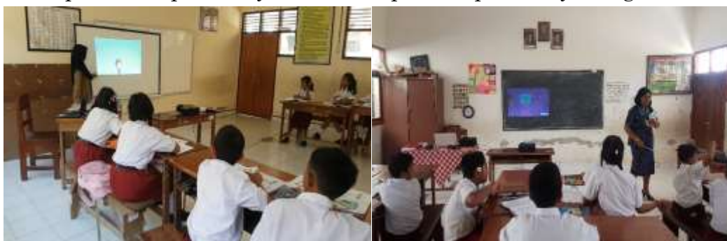
Gambar 3. Praktik PTK oleh dua guru model yang terpilih.

Kegiatan ini berupa pelatihan dan pendampingan penyusunan PTK. Kegiatan ini bertujuan untuk me-refresh dan memotivasi guru mitra melakukan PTK untuk perbaikan kualitas pembelajaran dan menghasilkan artikel ilmiah yang siap di submission secara online di jurnal ilmiah yang sudah dikenalkan pada kegiatan sebelumnya. Kegiatan penyusunan PTK dipaparkan oleh ahli pendidikan dasar dari Program Studi Pendidikan Guru Sekolah Dasar dari Universitas Pendidikan Ganesha. Kegiatan dilanjutkan dengan pendampingan secara kontinu mulai judul penelitian yang diangkat disesuaikan dengan masalah yang dialami guru mitra dan penyesuaian video pembelajaran yang dirancang sebelumnya dengan model pembelajaran yang dipilih guru mitra. Pada gambar 3. merupakan screenshot penerapan video pembelajaran dalam praktik pembelajaran guru mitra.