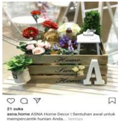
Gambar 1. Instagram Sebelum Menggunakan Caption.

Pada Gambar 1 ini, Asna Home memasarkan produknya tanpa menyisipkan caption yang unik dengan bahasa bersifat persuasif. Gambar ini diterbitkan tanggal 19 Maret 2018 yang merupakan gambar pertama di akun Instagram Asna Home Decor. Dapat dilihat pada gambar ini hanya ada dua puluh satu orang yang menyukai gambar ini. Teks di gambar ini dibuat sangat sederhana hanya berupaya menyampaikan produk yang dijual. Bisa dibandingkan dengan gambar berikut ini saat ditambahkan caption pada gambar produk Asna Home Decor.