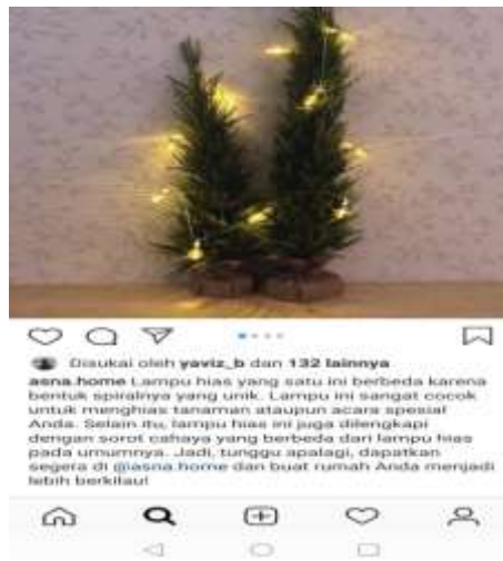
Gambar 3. Produk Asna Home Dengan Caption .

Apabila kita analisis paragraf di atas tidak ada satu kalimat yang berbicara tentang Hari Natal. Akan tetapi, redaksi bahasa yang dibuat tetap bersifat persuasif dengan beberapa kata kunci seperti ‘acara spesial’. Hal ini bertujuan untuk menarik minat pembeli yang membutuhkan dekorasi untuk merayakan Natal. Di media sosial seperti Instagram, penggunaan bahasa yang tepat sangat berpengaruh terhadap minat pembeli. Telah disampaikan dalam pembahasan sebelumnya, bahwa terjadi peningkatan penjualan dengan menggunakan sistem daring yang disampaikan dengan redaksi yang menarik.