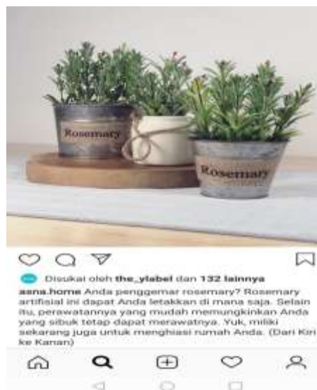
Gambar 2. Produk Asna Home dengan Tambahan Caption

Pada Gambar 1 ini, Asna Home memasarkan produknya tanpa menyisipkan caption yang unik dengan bahasa bersifat persuasif. Gambar ini diterbitkan tanggal 19 Maret 2018 yang merupakan gambar pertama di akun Instagram Asna Home Decor. Dapat dilihat pada gambar ini hanya ada dua puluh satu orang yang menyukai gambar ini. Teks di gambar ini dibuat sangat sederhana hanya berupaya menyampaikan produk yang dijual. Bisa dibandingkan dengan gambar berikut ini saat ditambahkan caption pada gambar produk Asna Home Decor.