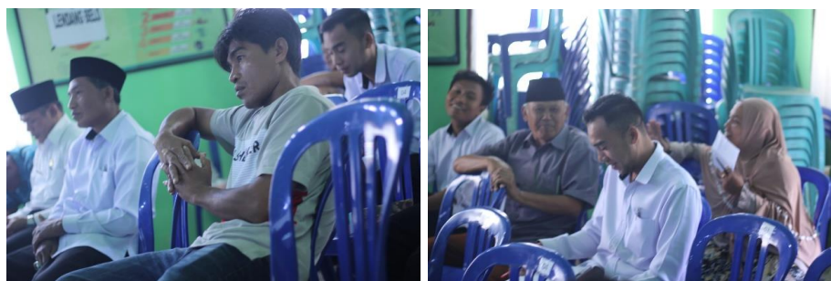
Gambar 3. Proses Penyampaian Materi

Pada pelaksanaan pengabdian Masyarakat diawali dengan absensi dan pendataan Masyarakat yang datang Ketika pengabdian Masyarakat. Setelah itu, Tutor memberikan Materi Edukasi Penggunaan Gadget dalam Penggunaan Internet Sehat, Aman, kreatif, dan inovatif Bagi Warga Sekitar Pajang ini disampaikan oleh tim dosen dari Universitas Bumigora kedepan para peserta dalam hal ini warga sekitar Pajang. Dimulai dengan penyampaian materi dan diakhiri dengan diskusi dan tanya jawab, seperti terlihat pada Gambar 3.