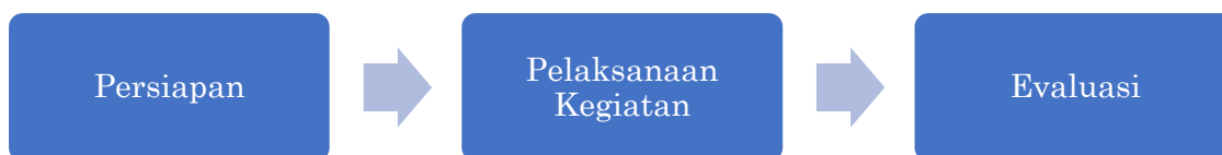
Gambar 1. Metode Pelaksanaan Pengabdian Masyarakat

Materi yang diberikan berupa kegiatan Edukasi Penggunaan Gadget dalam Penggunaan Internet Sehat, Aman, kreatif, dan inovatif Bagi Warga Sekitar Pajang. Pelaksanaan kegiatan ini dilakukan secara langsung di lokasi dengan dilakukan protokol kesehatan yang ketat. Target Peserta Pengabdian Masyarakat ini adalah warga Pajang. Jadwal pelaksanaan kegiatan pengabdian kepada masyarakat, seperti terlihat pada Tabel 1.