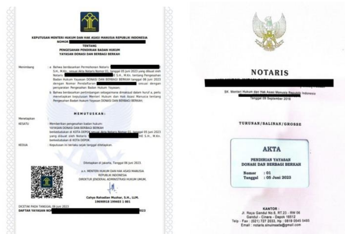
Gambar 9. Salinan Akta Notaris dan SK Kemenkumham Pendirian Yayasan