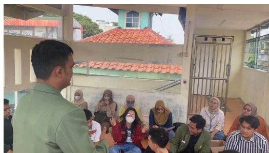
Gambar 2. Tanya Jawab Narasumber dengan Peserta

Gambar di atas menunjukkan bahwa Narasumber memberikan materi dengan tema “pelatihan Pendaftaran Badan Hukum”. Pelaksanaan pelatihan ini mengangkat beberapa materi yang mendukung tujuan pelatihan ini, yaitu sebagai berikut: (1) Pendirian Badan Hukum sebagai bentuk Kepastian Hukum: Memberikan status hukum yang jelas dan terpisah, memastikan kegiatan perkumpulan berjalan secara sah; (2) Pendirian Badan Hukum sebagai bentuk Perlindungan Hukum: Melindungi anggota dan pengurus dari tanggung jawab pribadi terhadap kewajiban perkumpulan; dan (3) Pendirian Badan Hukum menjadikan partisipasi lebih luas: Memungkinkan keterlibatan lebih luas dalam kolaborasi dan jaringan, meningkatkan peluang akses pendanaan, hibah, dan dukungan dari pihak eksternal serta meningkatkan reputasi dan kredibilitas di mata masyarakat, pemerintah, dan mitra potensial, seperti terlihat pada Gambar 2.