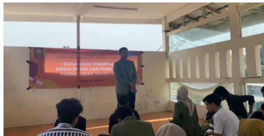
Gambar 1. Paparan Narasumber dengan Materi Pendaftaran Badan Hukum

Tim pengabdian melakukan pelatihan pendaftaran badan hukum. Pelatihan dilakukan dengan terlebih dahulu penyampaian materi oleh ketua tim pengabdian, seperti terlihat pada Gambar 1.