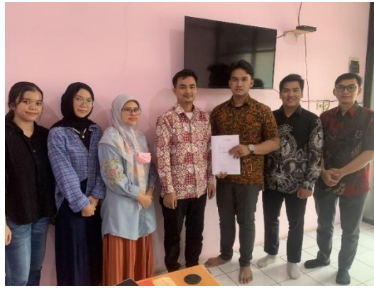
Gambar 8. Kegiatan Pendampingan Pendirian Badan Hukum ke Notaris Depok