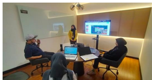
Gambar 3. Mahasiswa Saat Magang

Aktivitas selanjutnya, DPP berfokus kepada kegiatan divisi atau posisi Shipper Academy Branding Intern, dimana ada 6 kompetensi yang disajikan yaitu (1) Brand Awareness and Strategy ; (2) Event Management ; (3) Data Analytic ; (4) Customer Behavior ; (5) Excellent writing skills ; dan (6) Marketing Technique (Marketing Channels) . Kegiatan yang dilakukan mahasiswa antara lain mahasiswa melakukan benchmarking terhadap konten di tempat lain, melakukan monitoring secara rutin terkait produk produk, mendukung karyawan untuk membuat event di perusahaan dan membuat undangan event dan melakukan sosialisasi event . Kegiatan magang mahasiswa juga dipantau melalui zoom meeting . Dalam pertemuan ini mahasiswa menyampaikan berbagai kegiatan selama magang, hambatan dan tantangannya.