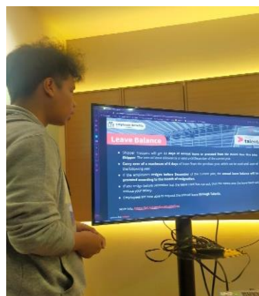
Gambar 4. Mahasiswa Saat Magang