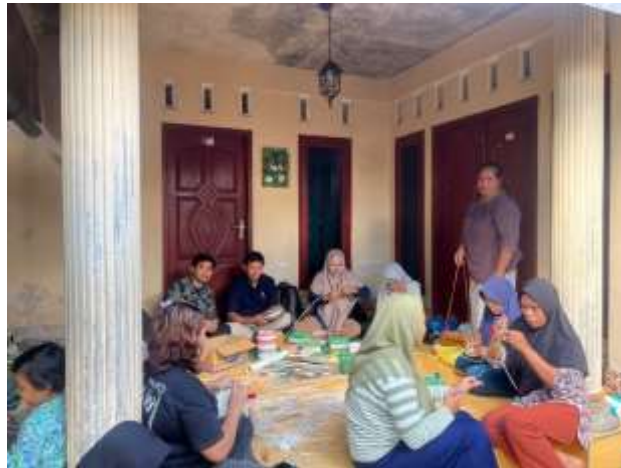
Gambar 1. Pelatihan Digital Marketing.

produk. Sedangkan metode praktik merupakan sarana latihan secara langsung peserta dalam digital marketing .