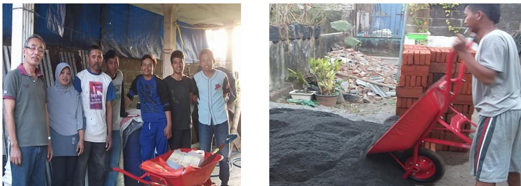
Gambar 1. Persiapan Berkegiatan dan Pengkutan Material Bipgas.

Program PPM ini diawali dengan persiapan semua bahan material termasuk pengadaan peralatan yang dibutuhkan untuk realisasi semua kegiatan yang sudah dirancang. Pengadaan batu bata, pasir dan semen untuk merenovasi digester bangunan biogas, sambungan pemasangan lampu penerang dapur dan kandang dan pembuatan penampungan outlet limbah biogas untuk pupuk organik yang terletak di bagian belakang dekat lahan rumput. Dilanjutkan pembelian dan pengadaan Arco pengangkut, dan bahan pakan konsentrat sapi perah dan pengiriman material untuk renovasi Biogas seperti terlihat pada Gambar 1.