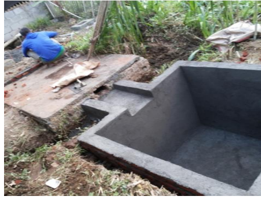
Gambar 3. Renov. digester Biogas. Gambar 4. Outlet limbah Biogas.

Proses penguraian material organik terjadi secara anaerob (tanpa oksigen). Biogas terbentuk pada hari ke 4 – 5 sesudah biodigester terisi penuh, dan mencapai puncak pada hari ke 20 – 25. Biogas yang dihasilkan oleh biodigester sebagian besar terdiri dari 50 – 70% metana CH_4 , 30 – 40% karbondioksida CO_2 , dan gas lainnya dalam jumlah kecil (Irawan & Suwanto, 2017). Menurut (Marwah et al., 2016) ada tiga kelompok bakteri yang berperan dalam proses pembentukan biogas, yaitu 1). Kelompok bakteri fermentatif: yaitu Streptococci , Bacteriodes , dan beberapa jenis Enterobacteriaceae , 2). Kelompok bakteri asetonik: Desulfovibrio 3). Kelompok bakteri penghasil gas metana meliputi Mathanobacterium , Mathanobacillus , Methanosacaria , dan Methanococcus . Secara alami bakteri methanogen dapat diperoleh dari berbagai sumber seperti: air bersih, endapan air laut, sapi, kambing, lumpur ( sludge ) kotoran anaerob ataupun TPA (Tempat Pembuangan Akhir).