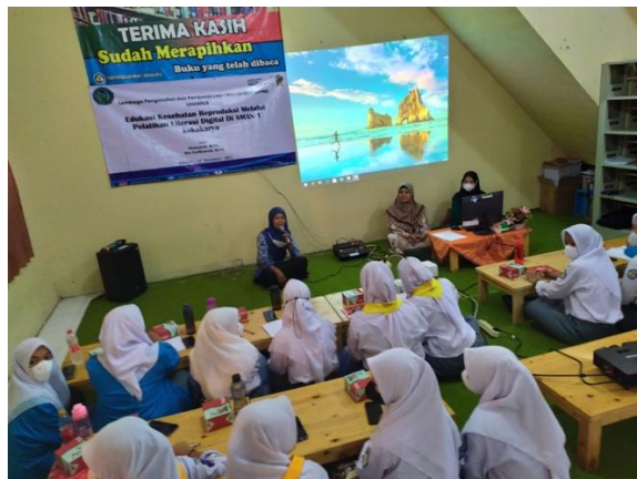
Gambar 3. Pembukaan Pelatihan Oleh Wakil Kepala Sekolah.