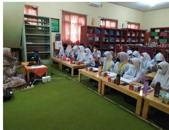
Gambar 4. Pemberian Materi Oleh Narasumber.