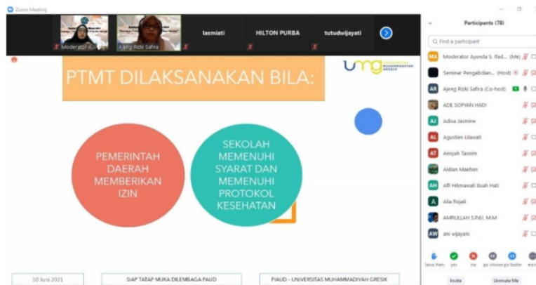
Gambar 3. Penyampaian materi oleh pemateri