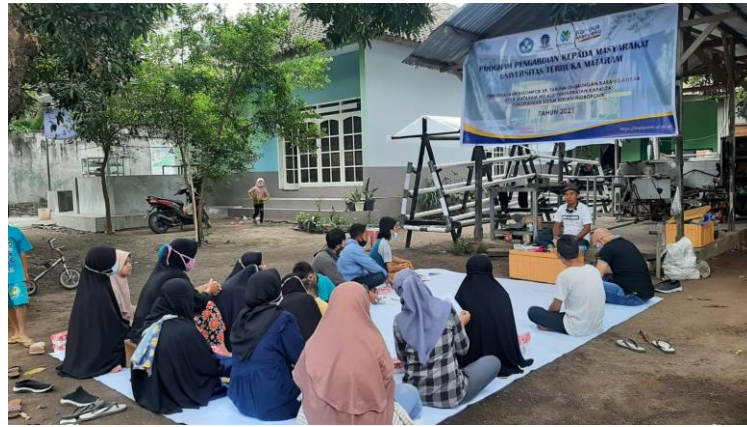
Gambar 1. Pelaksanaan Pelatihan