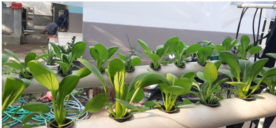
Gambar 3. Tinggi ukuran sayuran minggu ke-3 pasca pembibitan