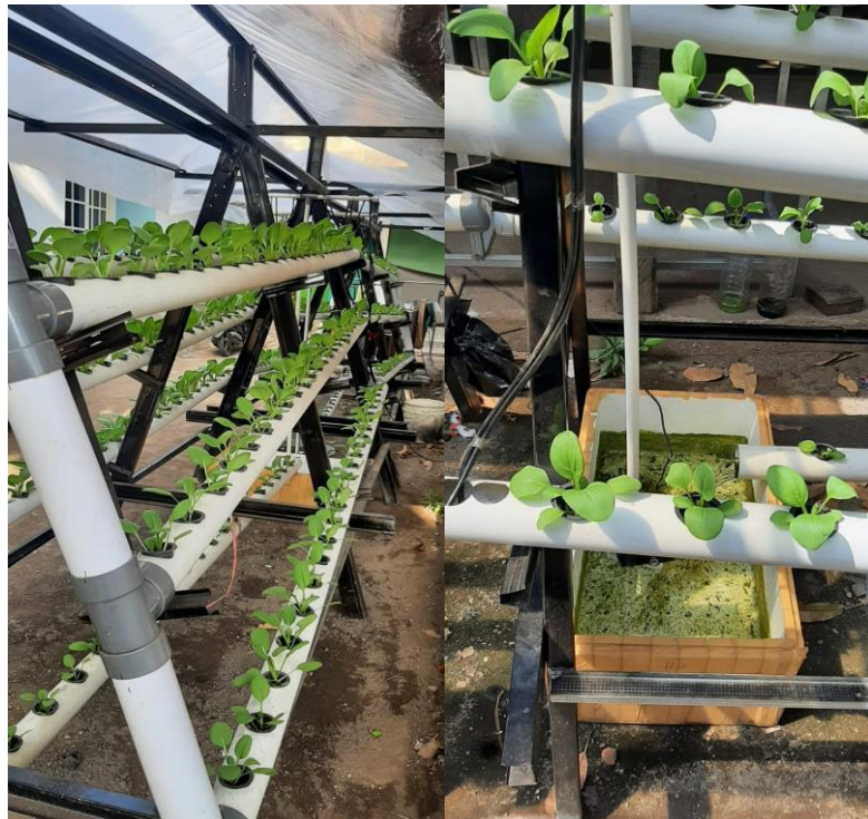
Gambar 2. Perkembangan pertumbuhan pada instalasi hidroponik