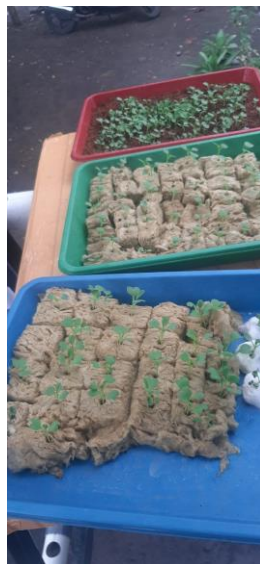
Gambar 2. Pertumbuhan bibit pada beberapa jenis media tanam

Setelah menunggu selama kurang lebih 10-14 hari, penyemaian bibit membuahkan hasil yang cukup menggembirakan, dari ketiga jenis media tanam yakni, Rockwool, Cocopeat dan Kapas, Mitra mendapatkan pengetahuan dan pemahaman bahwa jenis media tanam yang memberikan hasil penyemaian bibit yang paling maksimal adalah media tanam rockwool (Gambar 2.)