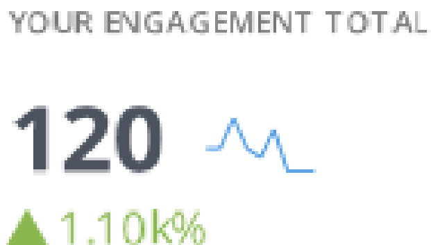
Gambar 3. Total engagement Instagram BUMDes Sekapuk

Dari gambar diatas hasil analisis yang didapat, menunjukkan peningkatan engagement atau keterlibatan pengikut dengan konten media sosial BUMDes Sekapuk. Total engagement yang dicapai adalah 120, yang mencerminkan jumlah total interaksi yang dilakukan oleh pengikut dengan konten-konten di dalamnya. Ini mencakup berbagai jenis interaksi, seperti komentar, suka, berbagi, dan reaksi lainnya. Engagement rate, atau tingkat keterlibatan, dihitung sebagai persentase dari total pengguna yang berinteraksi dengan konten dibandingkan dengan total pengguna. Dalam kasus ini, tingkat keterlibatan adalah 13,4%, atau 1.10k%, yang menunjukkan bahwa sekitar 13,4% dari total pengguna berinteraksi dengan konten media sosial BUMDes Sekapuk selama periode ini.