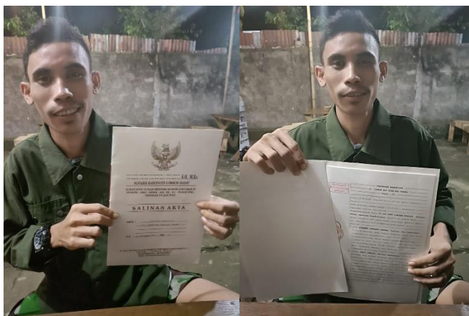
Gambar 2. Penyerahan Akta Ijin Usaha

Total waktu pendampingan pendirian usaha ini selama kurang lebih empat bulan. Sejak bulan Juli 2021, kami melakukan pertemuan awal untuk mengidentifikasi masalah pihak mitra. Pertemuan selanjutnya menentukan nama merek usaha yang disepakati bernama Lombok Bay Tour & Travel. Kemudian kami membantu dalam pembuatan akta pendirian usaha. Setelah akta jadi, lalu tahap selanjutnya membuat akun sosial media sebagai media pemasaran di Instagram dengan nama akun @lombokbaytour. Konten-konten apa saja yang cocok untuk pemasaran media sosial, bagaimana proses public relation kepada calon konsumen, bagaimana optimasi konten agar menarik sehingga orang tertarik datang ke Lombok dan menggunakan jasa kita, membuat paket wisata yang menarik dan berbeda dengan usaha lainnya, membuat positioning usaha yang mencirikan usaha kita, membidik target konsumen potensial, kemampuan dan personaliti yang dibutuhkan sebagai penyedia jasa pariwisata, product knowledge , menjalin kerja sama dengan usaha sejenis, dan lain sebagainya merupakan program dalam pertemuan kami dengan mitra. Hingga pada akhirnya usaha ini mendapatkan konsumen pertamanya/wisatawan yang datang ke Lombok menggunakan jasa mereka. Lalu setelah itu kami tim pelaksana melepas usaha ini untuk berjalan, namun dalam kesepakatan verbal, kami akan selalu siap untuk membantu bila terjadi kendala di kemudian hari.