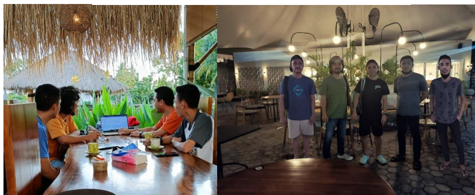
Gambar 1. Pendampingan Pendirian Usaha