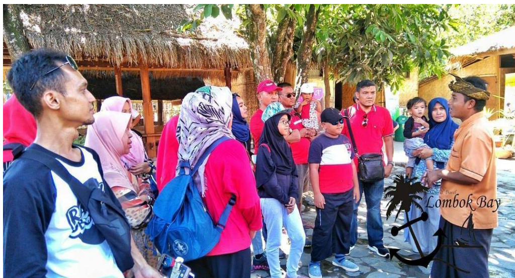
Gambar 6. Konsumen Pertama Lombok Bay Tour & Travel