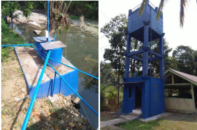
Gambar.3. Kondisi SPAM Desa Piji Tahun 2019

BP-SPAM "Tirta Wening" adalah memanfaatkan aplikasi media sosial Grup Whatsapp untuk laporan permasalahan kerusakan jaringan air minum. Pengelola telah menerapkan aturan dan sanksi terkait hak dan kewajiban pengguna dan berlaku sampai saat ini. Keberlanjutan pengelolaan SPAM Desa mulai tahun 2017 di desa Piji diteruskan oleh KP-SPAM yang merupakan transformasi dari BP-SPAM dan menjadi bagian dari salah satu unit usaha BUMDES di Desa Piji.