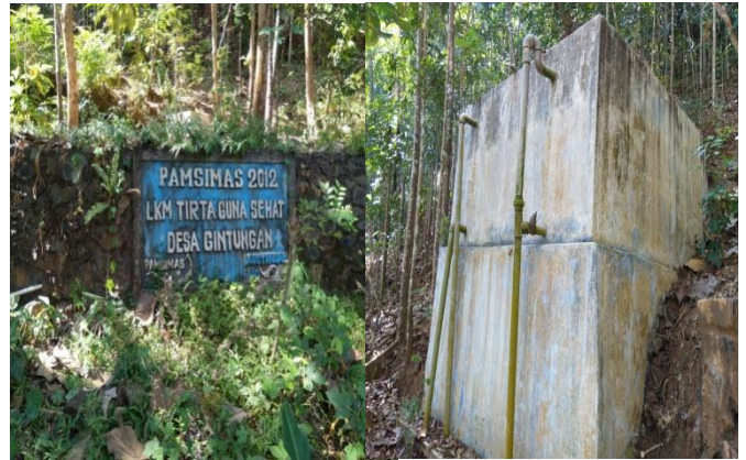
Gambar.4. Kondisi SPAM Desa Gintungan Tahun 2019

kinerja pengelola SPAM Desa Gintungan lumayan baik, tetapi seiring berjalannya waktu kinerjanya mulai menurun. Manajemen yang kurang baik ditambah lagi dengan tidak adanya norma aturan yang jelas dalam pemakaian air mempersulit dalam pengelolaan SPAM.