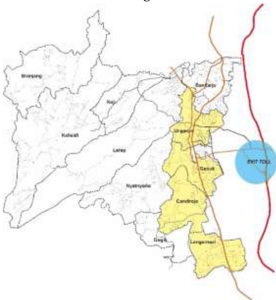
Gambar 2. Kawasan Dengan Pengurangan Jumlah Penduduk

Pengurangan jumlah penduduk terjadi pada empat kelurahan yang berbatasan langsung dengan Kecamatan Ungaran Timur, dalam hal ini lokasinya lebih dekat dan memiliki akses langsung dari jalan tol dibandingkan daerah lain di Kecamatan Ungaran Barat.