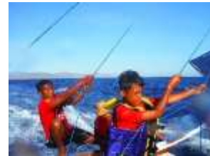
Gambar 1. Kegiatan Masyarakat dalam Lomba Perahu Layar

Dalam kegiatan wisata di Desa Sangiang, masyarakat sudah ikut berperan, hal ini ditunjukkan dengan masyarakat yang menerima dengan baik kedatangan wisatawan domestik maupun luar domestik. Masyarakat ikut andil dalam kegiatan wisata seperti dalam kegiatan Festival Sangiang Api yang diadakan tiap tahunnya, masyarakat berperan aktif dalam memeriahkan festival. Seperti halnya ikut dalam berbagai kegiatan yang diadakan dalam festival, melakukan kegiatan wirausaha yaitu mendagangkan hasil tenunan, kuliner dan sebagainya. Hal ini merupakan salah satu upaya dalam memanfaatkan wisata, yaitu ikut berperan dalam kegiatan wisata sehingga diharapkan dapat meningkatkan perekonomian masyarakat setempat.