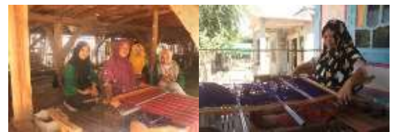
Gambar 2. Budaya Menenun Masyarakat Sangiang

Selain itu, dari hasil pengamatan yang dilakukan, masyarakat terbuka dengan kedatangan wisatawan dari luar maupun dalam negeri. Anak-anak Desa Sangiang akan dengan senang mendatangi para turis yang berdatangan dan berbincang dengan mereka. Adapun dalam kegiatan budaya menenun, masyarakat setempat juga akan menerima dengan baik apabila wisatawan yang ingin melihat, bertanya ataupun mencoba langsung pengalaman dalam menenun.