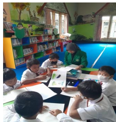
Gambar 6 Layanan Edukasi

Dinas Kearsipan dan Perpustakaan Kota Mataram juga menyediakan layanan Edukasi yang dimana anak-anak berkunjung ke perpustakaan bukan hanya datang membaca tetapi mereka bisa belajar sambil bermain dan memberikan edukasi tentang pengenalan ruangan-ruangan perpustakaan dan bahan bacaan yang akan mereka baca. Adapun kegiatan layanan edukasi saya lakukan pada Bulan Februari minggu ke- 1-2.