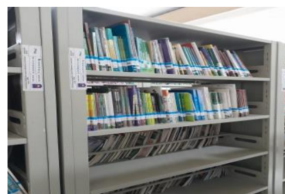
Gambar 1 Kondisi Koleksi Setelah di Shelving

Shelving merupakan menyusun atau menata bahan pustaka pada setiap rak sesuai urutan nomor kelasnya. Kegiatan ini berujuan untuk memastikan setiap koleksi berada pada rak yang sesuai dengan nomor kelasnya masing-masing dan untuk mengembalikan buku-buku yang telah dikembalikan oleh pemustaka untuk diletakkan kembali pada rak koleksi dan dapat dipergunakan lagi oleh pemustaka yang membutuhkan. Adapun aktivitas yang saya lakukan yaitu menyusun buku yang sudah selesai diberi nomor kelasnya dan diletakkan dirak sesuai dengan nomor kelas tersebut, Kegiatan selving ini saya lakukan apabila buku-buku sudah selesai diberi nomor barcod dan nomor kelasnya.