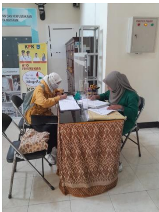
Gambar 5 Layanan Bebas Pinjam

Dinas Perpustakaan dan Kearsipan Kota Mataram, menyediakan layanan pembuatan surat bebas pinjam. Surat tersebut dapat dipergunakan sebagai syarat pembuatan skripsi/tugas akhir bagi para mahasiswa yang akan menyelesaikan salah satu tugas mereka pada jenjang tingkat akhir. Kegiatan pembuatan surat bebas pinjam ini saya lakukan pada Bulan Februari minggu ke- 1,2,3 dan 5 dan pada Bulan Maret minggu ke- 1-4.