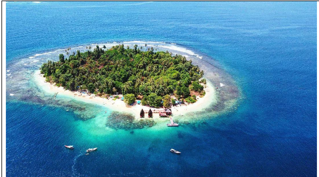
Gambar 3. Pulau Dua Aceh Selatan

Pembelajaran dapat diambil dalam proses wisata Pulau Dua adalah pengetahuan tentang pentingnya konservasi alam, ekosistem maritim, dan biota laut. Wisatawan yang datang berkunjung selain dapat mengurangi stress dari rutinitas harian seperti stress pekerjaan, tugas yang menumpuk, juga dapat mempelajari bagaimana menjaga kelestarian lingkungan hidup melalui interaksi langsung wisatawan dengan alam Pulau Dua. Berwisata di Pulau Dua juga mendukung kegiatan pendidikan terkait kemaritiman bahkan sejak usia dini dengan slogan: “aku cinta laut sejak kecil” karena wisata ini juga dapat dikunjungi oleh anak-anak dan tidak hanya orang dewasa saja. Wisata alam ke Pulau Dua dapat menjadi kegiatan perjalanan guna menikmati keunikan dan keindahan alam di wilayah wisata sekaligus mendapatkan edukasi di dalamnya. Belajar melalui alam bermanfaat untuk: (1) menghargai makhluk hidup di sekitarnya; (2) meningkatkan kreativitas; dan (3) mampu melatih motorik karena mengandalkan kemampuan fisik seperti berjalan jauh dan berlari.