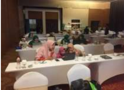
Gambar 4. Pendampingan membuat video slide dari power point

praktiknya, ada beberapa guru yang sudah bisa dan ada beberapa yang masih kesulitan mengoperasikannya. Kesulitan tersebut dapat diatasi dengan pendampingan bersama tim pengabdian. Anggota tim pengabdian melakukan pendampingan sesuai dengan arahan dari pemateri.