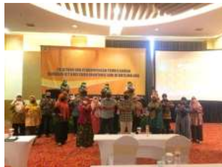
Gambar 2. Guru MGMP Akuntansi Peserta Kegiatan Pengabdian Jurusan Akuntansi FE UM

Kegiatan ini dilaksanakan 1 hari yaitu pada tanggal 24 Agustus 2020 mulai pukul 09.00 - 16.00 WIB.