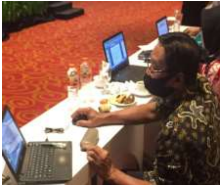
Gambar 5. Guru antusias mengikuti pelatihan

Guru sangat antusias dalam membuat soal di google formulir meskipun masih dalam tahap uji coba. Namun ada beberapa guru yang sudah bisa membuat. Setelah soal sudah jadi, maka guru perlu membagikan ke siswa. Oleh karena itu, guru diberikan informasi dalam penggunaan bit.ly untuk merubah nama link sesuai kebutuhan sebelum dibagikan ke siswa.