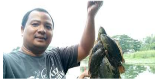
Gambar 3. Aktivitas memancing