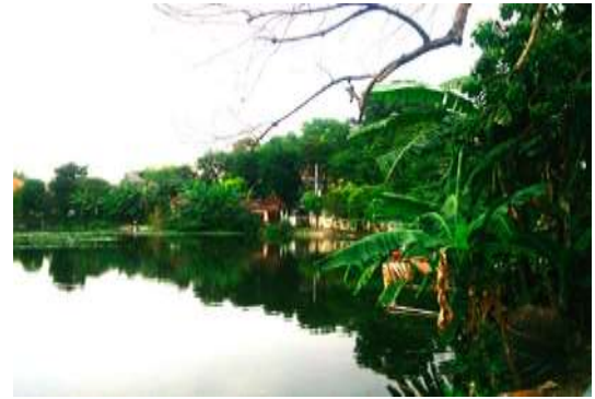
Gambar 4. Pepohonan yang tumbuh liar di sekeliling Telaga