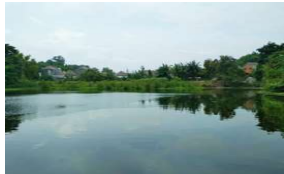
Gambar 5. Semak dan pepohonan yang tumbuh di tengah telaga

Kondisi lingkungan telaga hingga saat ini masih terlihat asri dengan banyaknya pepohonan yang tumbuh walaupun terkesan liar dan kumuh karena pembuangan sampah yang ada di sebagian sisi telaga.