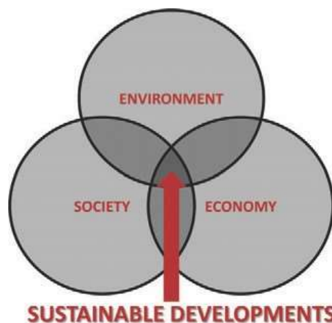
Gambar 1. Model pembangunan berkelanjutan, (Lawrence, 2000)

Keberlanjutan adalah untuk memenuhi "kebutuhan masa kini tanpa mengorbankan kemampuan masa depan untuk memenuhi kebutuhannya sendiri" dalam sebuah sistem konsep 'Keberlanjutan'. telah berubah menjadi area yang luas yang mencakup berbagai tingkat aktivitas dan pengetahuan manusia dengan mempertimbangkan tiga prinsip utama: Lingkungan, Ekonomi, dan Masyarakat (lihat gambar 1). Oleh karena itu, Di sektor bangunan dan perkotaan, ia menginginkan semua tingkat prosedur perancangan dan konstruksi untuk mengurangi dampak negatif lingkungan binaan terhadap sistem ekologi (cuaca, tanah, air, energi, dan konsumsi sumber daya). Selain itu, untuk menciptakan sistem ekonomi yang masuk akal namun layak dengan dasar etika dan mendorong kesetaraan dan tanggung jawab dalam sistem dan nilai sosial dan budaya. Seperti terlihat pada gambar 1