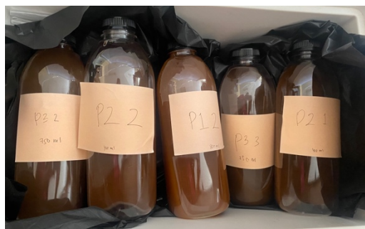
Gambar 5. Sampel Hasil Pupuk Organik Cair dari Limbah Kulit dan Ampas Kopi

Produksi pertanian secara keseluruhan dapat ditingkatkan dengan penggunaan pupuk organik cair. Pupuk organik cair memiliki potensi besar untuk mengurangi limbah organik dan meningkatkan keberlanjutan pertanian karena mereka menyerap nutrisi lebih baik oleh tanaman, menghasilkan tanaman yang lebih sehat dan buah yang lebih banyak. Selain itu, pupuk organik cair meningkatkan aktivitas mikroba di tanah dan kesuburannya, sehingga dapat meningkatkan hasil panen dan kualitas produk pertanian. Dengan menerapkan metode ini secara luas, dapat mengurangi efek lingkungan yang merugikan sambil meningkatkan kesejahteraan petani dan produktivitas pertanian. Perhitungan analisis ekonomi pupuk organik cair berbahan dasar limbah kulit dan ampas kopi penting untuk di evaluasi. Dengan dilakukan perhitungan analisis ekonomi, dapat memberikan gambaran mengenai potensi kelayakan finansial yang diperoleh dari pengolahan limbah kulit dan ampas kopi menjadi pupuk organik cair.