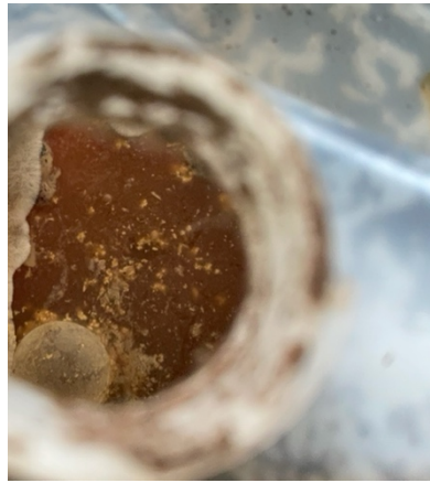
Gambar 4. Bercak Putih pada Pupuk Organik Cair yang telah di fermentasi selama 14 hari.