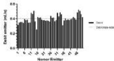
Gambar 3. Debit emitter jaringan irigasi tetes

yang disalurkan oleh seluruh emitter sehingga setiap tanaman memperoleh air yang sama tiap periode irigasi. Hal ini dilakukan sebagai salah satu upaya menghasilkan pertumbuhan cabai rawit yang optimal. Penentuan debit irigasi tiap emitter dilakukan dengan mengukur volume tetesan pada 50 buah sampel emitter dalam selang waktu 1 menit. Hasil pengujian debit tetesan emitter disajikan pada Gambar 3 berikut.