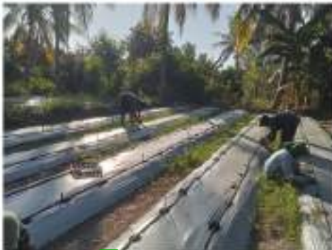
Gambar 2. Irigasi tetes tanaman cabai di Desa Siengen, Kabupaten Lombok Utara

Tata letak jaringan irigasi tetes yang digunakan adalah tipe jaringan sisir dimana pada tiap bedengan diinstal dua buah pipa lateral dengan jarak 50 cm. Pipa lateral tersebut terhubung oleh sebuah pipa dengan kran yang terhubung dengan pipa sub-utama yang terletak sepanjang 13 meter di sisi lahan. Gambar 2 menunjukkan irigasi tetes yang telah terinstal di lahan tanaman cabai Desa Siengen, Kabupaten Lombok Utara.