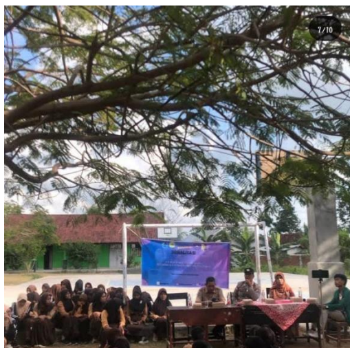
Gambar 2. Kegiatan Sabtu Sosialisasi Anti Bullying