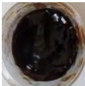
Gambar I. Sediaan gel antiseptik ekstrak etanol kulit buah pisang

Pengujian homogenitas bertujuan untuk mengetahui ada atau tidaknya partikel pada pada sediaan gel. Hal ini penting untuk diketahui, karena ketidakhomogenan suatu komponen di dalam suatu sediaan akan mempengaruhi efikasi yang dihasilkan (Numberi, 2020). Homogenitas suatu sediaan ditandai dengan adanya partikel kasar yang ada pada sediaan gel karena tidak terdispersi dengan baik. Berdasarkan uji homogenitas, menunjukkan bahwa pada keempat sediaan gel antiseptik tidak ditemukan adanya partikel kasar sehingga dapat dinyatakan bahwa sediaan gel antiseptik ekstrak etanol kulit buah pisang adalah homogen.