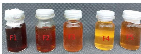
Gambar 2. Formulasi gel hand sanitizer ekstrak etanol daun namnam

Hasil menunjukkan bahwa sampel F1 sampai F5 memiliki bentuk semi padat. Hal ini dikarenakan dalam formulasi adanya gelling agent berupa CMC-Na. CMC-Na merupakan gelling agent yang sering digunakan dalam formula gel karena memberikan viskositas yang baik (Kusuma et al., 2018). Selain itu CMC Na juga memiliki sifat netral, resisten terhadap pertumbuhan mikroba, menghasilkan basis gel yang jernih dan film (selaput) yang kuat pada kulit ketika kering (Hariningsih, 2019) Hasil ini juga serupa dengan penelitian Kusuma yang menyatakan gel dengan gelling agent CMC Na menghasilkan tekstur kental (Kusuma et al., 2018).