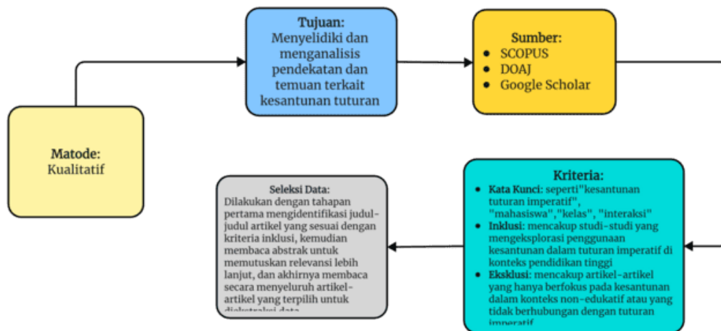
Gambar 1. Prosedur Penelitian

Kriteria inklusi mencakup studi-studi yang mengeksplorasi penggunaan kesantunan dalam tuturan imperatif di konteks pendidikan tinggi, baik yang dilakukan dalam bahasa Inggris maupun bahasa Indonesia, dan diterbitkan dalam jurnal ilmiah atau prosiding konferensi terakreditasi. Kriteria eksklusi mencakup artikel-artikel yang tidak relevan dengan topik penelitian ini, seperti studi-studi yang hanya berfokus pada kesantunan dalam konteks non-edukatif atau yang tidak berhubungan dengan tuturan imperatif. Seleksi data dilakukan dengan tahapan pertama mengidentifikasi judul-judul artikel yang sesuai dengan kriteria inklusi, kemudian membaca abstrak untuk memutuskan relevansi lebih lanjut, dan akhirnya membaca secara menyeluruh artikel-artikel yang terpilih untuk diekstraksi data. Data yang diekstraksi meliputi temuan-temuan utama terkait penggunaan kesantunan dalam tuturan imperatif, metodologi yang digunakan, hasil penelitian, dan implikasi praktis dari setiap artikel yang relevan.