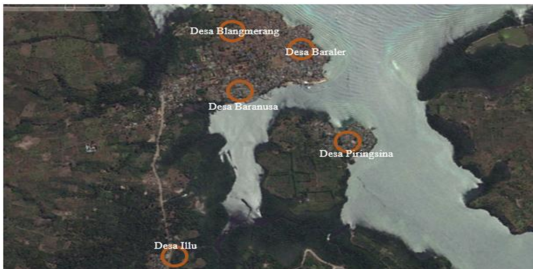
Gambar 1. Areal persebaran responden di lima Desa pesisir rumpun adat Baranusa

Tahapan menggunakan metode survey antara lain, (a) kuisisioner, secara umum berisi pertanyaan-pertanyaan melingkupi pemahaman responden, sedalam apa pengetahuan masyarakat tentang ritual adatia Mulung , Pertanyaan disusun berupa pilihan dan pertanyaan terbuka; (b) pembagian kuisisioner dan jawaban, kuisisioner dijalankan dengan metode wawancara, dimana responden ditemui satu demi satu oleh surveyor di rumahnya masing-masing. Jawaban responden dicatat oleh surveyor di kolom yang tersedia di lembar kuisisioner.