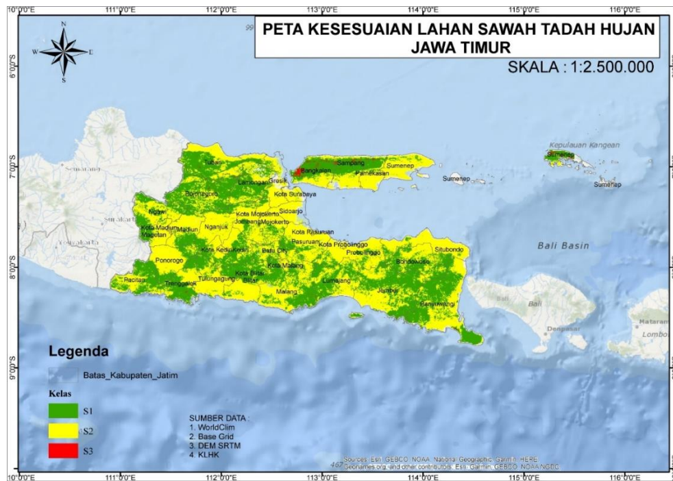
Gambar 2. Peta Kesesuaian Padi Tadah Hujan