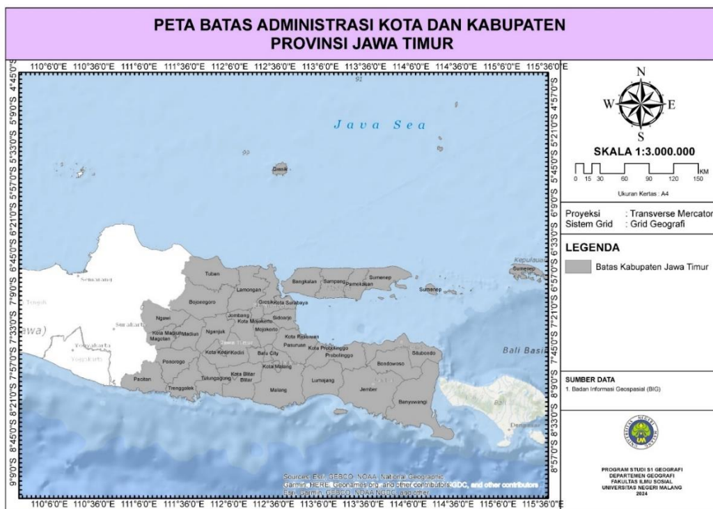
Gambar 1. Peta Daerah Kajian Penelitian

Penelitian ini termasuk dalam kegiatan dengan data sekunder yang diolah supaya dapat digunakan untuk melakukan analisis kesesuaian lahan, metode pengolahan data yang digunakan dalam penelitian ini adalah dengan melakukan overlay beberapa data sebagai salah satu langkah analisis spasial. Penelitian ini menggunakan analisis sistem geografis dengan melakukan overlay data tanah, curah hujan, topografi, suhu, dan salinitas untuk menghasilkan peta kesesuaian lahan komoditas padi sawah tadah hujan dan ubi jalar dengan wilayah kajian Provinsi Jawa Timur (Gambar 1). Teknik analisis spasial overlay data merupakan metode untuk menggabungkan dan menganalisis dua atau lebih data spasial yang berbeda untuk menghasilkan informasi baru. Teknik overlay bekerja dengan lapisan data yang memiliki atribut dan nilai sendiri yang mewakili karakteristik fenomena geografis yang dipetakan (ArcGIS Pro, 2024).