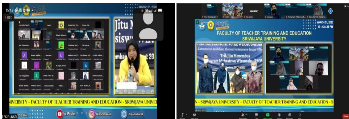
Gambar 2. Dokumentasi Pelaksanaan Webinar dan Coaching Kewirausahaan Secara Hybrid

Antusiasme peserta dalam mengikuti kegiatan webinar ini sangat besar, hal ini dapat dilihat dari keaktifan peserta dalam mengajukan berbagai pertanyaan yang selama ini menjadi kegunaan peserta. Beberapa pertanyaan yang diajukan, meliputi trik dan tips untuk memilih ide usaha yang biasanya akan lolos pada program PMW, karena terdapat beberapa peserta yang telah mencoba mengikuti program PMW ini, namun belum berhasil untuk memperoleh pendanaan usaha. Tim pemateri pun memberikan saran, untuk ide usaha yang dipilih harus up to date sesuai dengan perkembangan zaman, dan usahakan ide usaha tersebut unik dan berbeda dari ide-ide usaha pada umumnya. Kemudian, untuk ide dan identitas usaha juga harus memiliki makna filosofis tersendiri, dan tujuan mulia dari usaha yang hendak dijalankan, karena hal ini menjadi salah satu penilaian lebih yang sangat diperhatikan tim penilai. Karena sejatinya, seorang wirausaha bukan hanya selalu berorientasi pada keuntungan semata, namun juga harus memberikan dampak dan manfaat positif bagi sekitar, seperti terlihat pada Gambar 2.