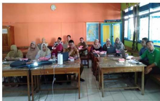
Gambar 2. Peserta antusias menerima materi