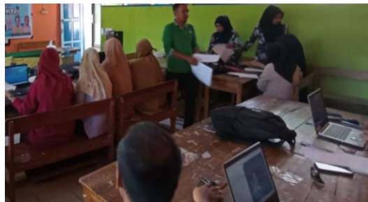
Gambar 3. Praktek menggunakan Mendeley