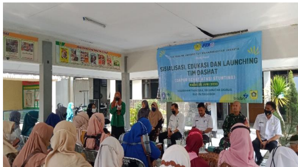
Gambar 3. Dokumentasi kegiatan sosialisasi, edukasi, dan pembentukan Tim DASHAT

program pengabdian kepada masyarakat. Pada kegiatan ini dihasilkan pembentukan Tim DASHAT yang diresmikan langsung oleh Pak Camat Ciomas. Tim DASHAT yang terbentuk telah mendapatkan SK Lurah Padasuka No. 141.2/21/KPTS/VII/2022 tertanggal 30 Juni 2022. Struktur Tim DASHAT terdiri dari Ketua PKK, Koordinator Kader, serta kader RW 1, 2 dan 3 di Kelurahan Padasuka, seperti terlihat pada Gambar 3.