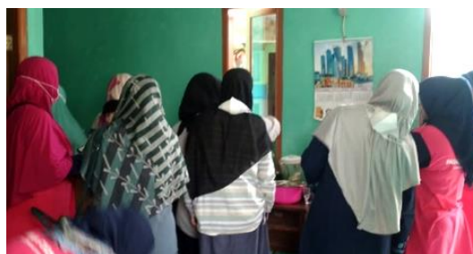
Gambar 4. Dokumentasi pelatihan

Dilakukan pada tanggal 3 Juli 2022 di Posyandu Anugerah RW 01 Kelurahan Padasuka dan dihadiri 20 orang yang terdiri dari Tim DASHAT. Kegiatan ini berlangsung mulai pukul 08.00 – 12.00 WIB yang mencakup edukasi tentang bahan makanan yang baik untuk bayi dan pelatihan cara pengolahan MPASI dari mulai persiapan bahan mentah, proses pemasakan, pemorsian bubur yang sudah matang, hingga pendistribusian MPASI ke bayi sasaran. Seluruh kader yang hadir turut berpartisipasi dalam proses pelatihan. Dokumentasi kegiatan dapat dilihat pada Gambar 4.