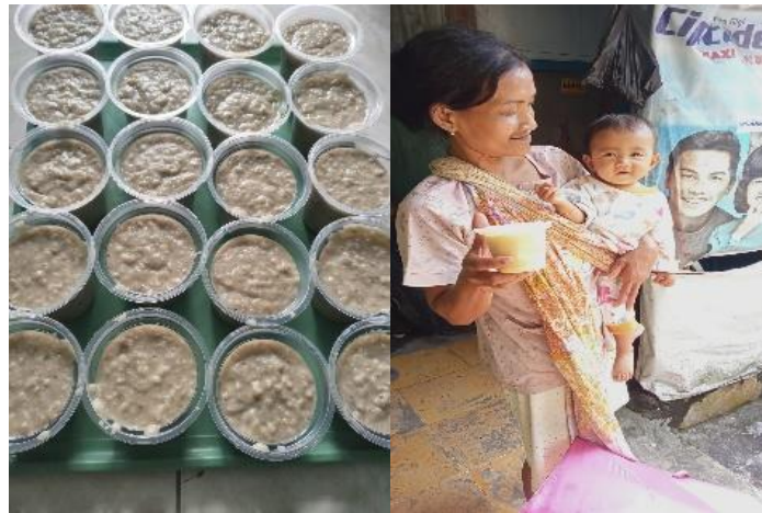
Gambar 5. Dokumentasi kegiatan Tim DASHAT

Monitoring kegiatan yang telah dilakukan dapat memberikan gambaran tingkat keberhasilan program intervensi gizi yang dilakukan oleh Tim DASHAT. Monitoring bulanan dilakukan oleh Tim PKM UMJ dengan mengunjungi kegiatan posyandu setiap bulan dan melihat secara langsung proses pengolahan hingga distribusi dan pencatatan konsumsi MPASI yang diberikan kepada bayi sasaran.