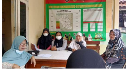
Gambar 2. Dokumentasi kegiatan rapat persiapan

Kegiatan dilaksanakan pada tanggal 8 Juni 2022, dihadiri oleh 15 orang yang terdiri dari pihak kelurahan Padasuka, Ketua PKK, kader posyandu dan koordinator kader kelurahan Padasuka. Kegiatan ini berlangsung selama kurang lebih 90 menit berupa diskusi perancangan struktur Tim DASHAT, menentukan jadwal tempat dapur DASHAT, dan menyusun anggaran dana. Dokumentasi kegiatan dapat dilihat pada Gambar 2.