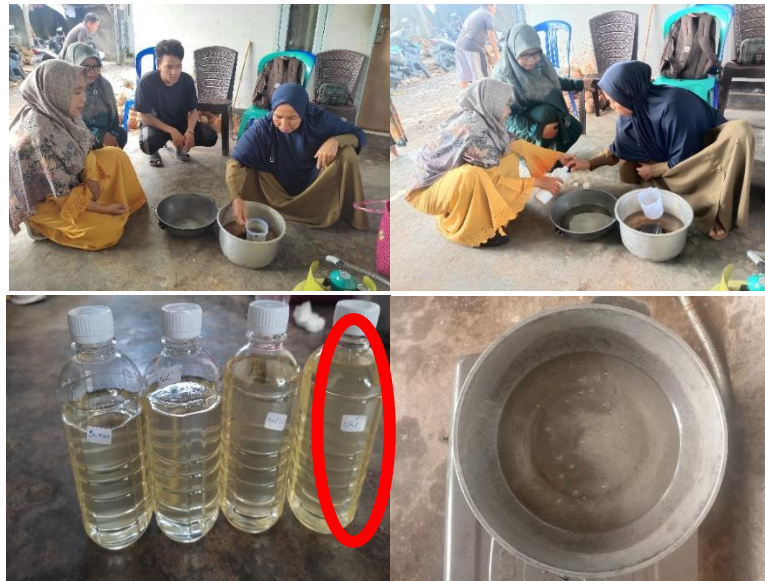
Gambar 4. Kegiatan aplikasi teknologi pemurnian pada minyak kelapa yang dihasilkan

yang dicobakan seperti hasil penelitian Maherawati & Suswanto (2020) dengan menggunakan NaOH 0.96%, dengan garam, dengan penyaringan dan juga keseluruhan proses seperti yang disajikan pada Gambar 4.