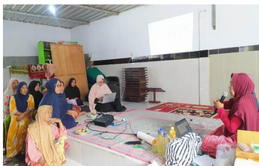
Gambar 3. Kegiatan penyuluhan tentang aplikasi teknologi pemurnian pada minyak kelapa

Pelaksanaan kegiatan pengabdian diawali dengan melakukan penyuluhan seperti yang disajikan pada Gambar 3. Penyuluhan merupakan salah satu metode transfer ilmu pengetahuan yang mudah dilakukan sehingga masyarakat dapat lebih memahami apa yang disampaikan (Nurhayati et al., 2021). Penyuluhan ini juga memberikan gambaran terkait dengan teknologi yang akan didemonstrasikan. Materi dari penyuluhan ini diawali dengan teknik-teknik pengolahan minyak kelapa, lalu diikuti dengan nilai gizi minyak kelapa dibandingkan minyak sawit dan diakhiri dengan teknik-teknik pemurnian pada minyak kelapa, seperti pada Gambar 3.