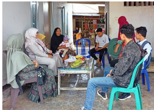
Gambar 2. Kegiatan koordinasi dan sosialisasi kegiatan

Kegiatan ini diawali dengan melakukan koordinasi dan terlebih dahulu dengan mitra terkait penentuan tempat dan waktu kegiatan, peralatan yang digunakan, dan jumlah peserta yang terlibat dalam kegiatan. Koordinasi ini dilakukan secara langsung dan juga melalui aplikasi whatsapp jika ada yang kurang terkait persiapan kegiatan, seperti terlihat pada Gambar 2.