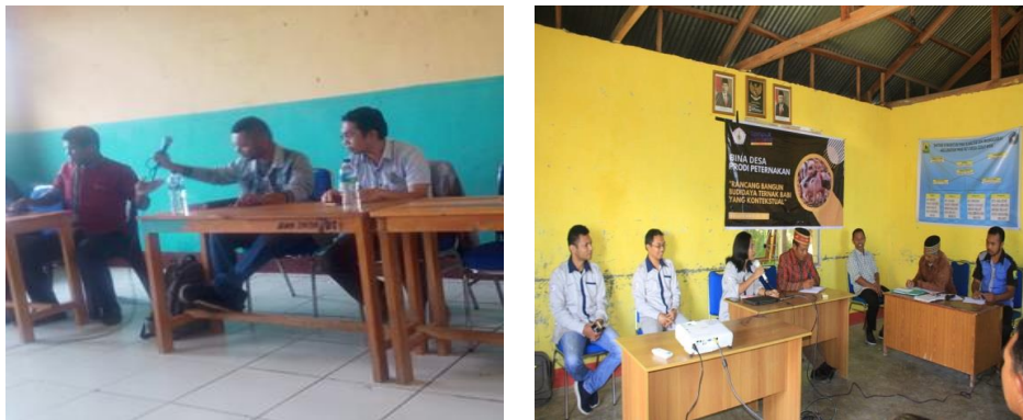
Gambar 2. Kegiatan Sosialisasi Rancang Bangun Usaha Ternak Babi.

ini dijalankan oleh civitas akademika (dosen Program Studi Peternakan, Fakultas Pertanian Dan Peternakan, Unika Santu Paulus Ruteng) dibantu kelompok mahasiswa melakukan penyuluhan khususnya pada aspek sosial ekonomi seperti berapa syarat jumlah ternak babi yang dipelihara agar mampu mendapatkan keuntungan serta bagaimana manajemen pemeliharaan ternak babi yang ekonomis agar mampu meningkatkan status sosial dan pendapatan ekonomi rumahtangga peternak. Hasil kegiatan menunjukkan bahwa, secara keleuruhan peserta yang hadir mengikuti kegiatan pada konsep pilar pertama adalah: menindaklanjutinya melalui upaya peningkatan produktifitas ternak melalui skala kepemilikan usaha guna meningkatkan pendapatan ekonomi rumahtangga serta mampu meningkatkan status sosial anggota rumahtangga melalui jumlah kepemilikan ternak. Proses kegiatan penyuluhan dalam konsep pilar pertama dapat dilihat dalam Gambar 2.