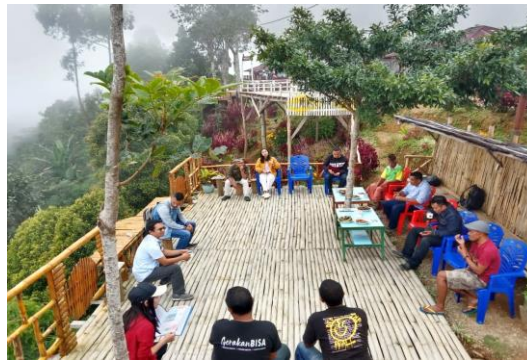
Gambar 4. Diskusi Bersama Aparat Desa Terkait Rancang Bangun Usaha Berkelanjutan

Berdasarkan penjelasan di atas secara keseluruhan pada masing-masing pilar tersebut, dianggap sebagai pilar utama karena sebagai faktor motivasi pendorong yang akan dicapai pada budaya kewirausahaan dalam mendukung sosial ekonomi masyarakat desa Golo Wua. Hal ini sependapat dengan Sabat & Setyani (2023) yang menyatakan bahwa, faktor motivasi peternak diartikan sebagai suatu kondisi yang mendorong seseorang untuk melakukan tindakan dalam mencapai tujuan. Oleh karena itu, pondasi yang fundamental untuk mendirikan pilar-pilar tersebut dalam mencapai tujuan pembangunan rumahtangga sehingga dapat berhasil dengan baik dan kokoh adalah pembentukan dan pembangunan infrastruktur fundamental Christiyani (2019) seperti pembentukan; modal fisik, modal manusia dan modal budaya kewirausahaan sebagai integrasi dari culture capital dan financial capital .