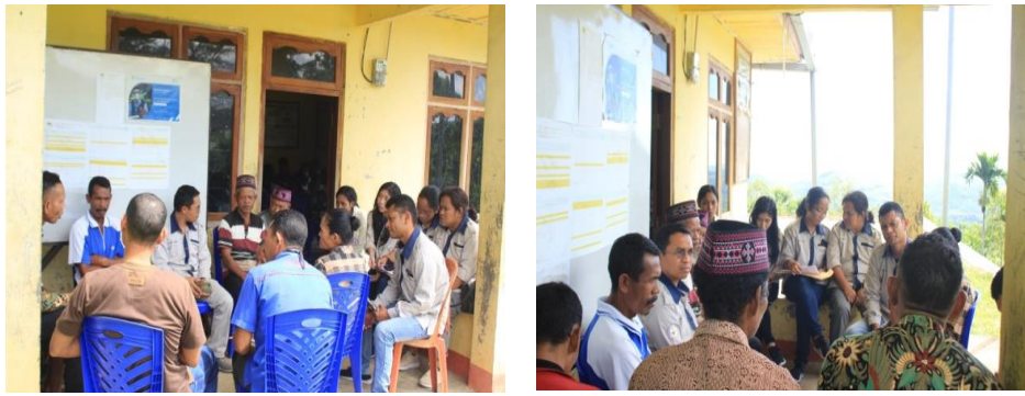
Gambar 3. Kegiatan Pelatihan Rancang Bangun Analisis Usaha

Pilar ketiga, rekomendasi kerjasama dengan pihak pemilik modal. Pemberdayaan yang dimaksud disini adalah untuk memberikan daya kekuatan (modal usaha) bagi masyarakat. Peran (dosen) bersama mahasiswa (Program Studi Peternakan, Fakultas Pertanian Dan Peternakan, Unika Santu Paulus Ruteng) pada pilar ini adalah akan merekomendasikan kerjasama dengan pihak pemilik modal seperti koperasi dan Bank daerah (Bank NTT) atau bank lainnya untuk memfasilitasi berupa pinjaman modal dengan bunga terjangkau kepada kelompok tani masyarakat Desa Golo Wua.