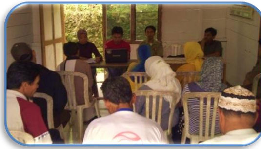
Gambar 1. Edukasi bersama petugas PLN dan Tim PKM

Berdasarkan data yang diperoleh dari warga setempat, dalam hal ini ketua RT/RW dan tokoh masyarakat mengatakan bahwa jumlah unit rumah yang terdapat di lorong 3 sebanyak 30 unit rumah, dengan kondisi rumah permanen dan semi permanen. Sedangkan di lorong 4 terdapat 25 unit rumah dan lorong 5 sekitar 35 unit rumah. Semua jenis bangunan yang terdapat pada kawasan permukiman tersebut, termasuk kategori 35% permanen dan 65% semi permanen, sehingga resiko terjadinya kebakaran pada kawasan tersebut, termasuk kategori rawan. Jenis kegiatan edukasi dan praktek penggunaan listrik rumah tangga menjadi prioritas untuk di aplikasikan pada kawasan tersebut.