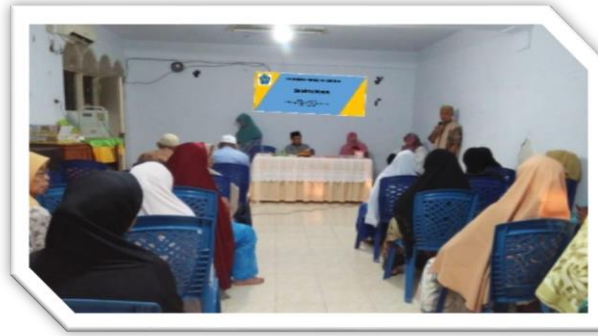
Gambar 2. Sosialisasi organisasi 'Aisyiyah'

Dalam kegiatan ini, masih banyak ibu-ibu di kawasan tersebut yang belum memahami "Aisyiyah". Asumsi mereka bahwa organisasi merupakan kumpulan intelektual, sehingga tercipta sebuah kekeliruan untuk dapat mengetahui secara pasti tentang fungsi dan peran organisasi. Melalui sosialisasi tersebut, tentunya banyak harapan bahwa organisasi Aisyiyah menjadi potensi bagi perempuan dalam melakukan berbagai kegiatan, yang akan melanjutkan visi misi organisasi.