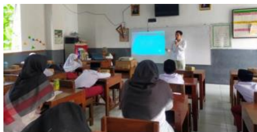
Gambar 2. Pelaksanaan Sosialisasi

Setelah sesi simulasi selesai, tahapan berikutnya berupa sesi simulasi (praktek) yang diikuti oleh siswa kelas 5. Praktik simulasi mitigasi bencana gunung meletus dilakukan sebanyak dua kali praktek. Sebelum memulai simulasi, narasumber memberikan teknis dan tahap simulasi dalam menghadapi bencana dan menyelamatkan diri. Dibantu dengan video dan suara sirine, kegiatan berjalan lancar dan siswa terlihat antusias mengikuti simulasi, seperti terlihat pada Gambar 3.