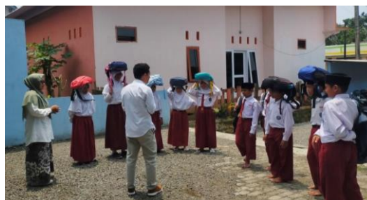
Gambar 3. Praktek Simulasi

Setelah sesi simulasi selesai, tahapan berikutnya berupa sesi simulasi (praktek) yang diikuti oleh siswa kelas 5. Praktik simulasi mitigasi bencana gunung meletus dilakukan sebanyak dua kali praktek. Sebelum memulai simulasi, narasumber memberikan teknis dan tahap simulasi dalam menghadapi bencana dan menyelamatkan diri. Dibantu dengan video dan suara sirine, kegiatan berjalan lancar dan siswa terlihat antusias mengikuti simulasi, seperti terlihat pada Gambar 3.