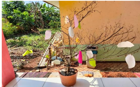
Gambar 2. Pohon Literasi

watak tokoh dari buku cerita yang dibacanya masing-masing. Begitu selanjutnya, dadu dikocok sebanyak enam kali sesuai unsur intrisik cerita hingga semua petunjuk di dalam dadu terjawab oleh semua siswa. Permainan dadu tersebut diakhiri dengan refleksi oleh guru. Menurut guru, permainan seperti itu membuat siswa senang karena mereka merasakan belajar sambil bermain, seperti terlihat pada Gambar 2.