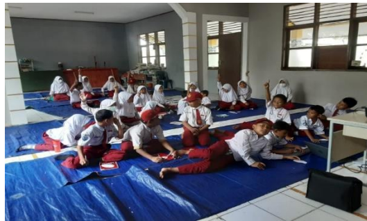
Gambar 3. Diskusi Setelah Menonton Film

film, seperti yang ditonton siswa SDN Anamui, merupakan sumber belajar yang tepat dimanfaatkan oleh guru (Rahmi, 2013), seperti terlihat pada Gambar 3.