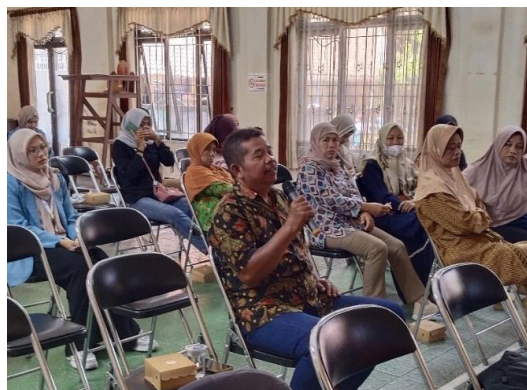
Gambar 3. Pelaku UMKM sedang bertanya terkait dengan materi pelaporan keuangan sederhana

Setelah selesainya kegiatan ini, selanjutnya yaitu tahapan evaluasi. Hal ini dimulai dari adanya tanya jawab yang mana memperjelas sejauh mana pemahaman pelaku UMKM terhadap penjelasan terkait dengan Literasi Keuangan. Setelah proses tanya jawab, pemateri memberi pertanyaan satu persatu kepada pelaku UMKM tersebut mengenai materi yang dijelaskan terkait literasi keuangan, beberapa telah menjawab dengan baik dan bersedia untuk didampingi dalam penyusunan laporan keuangan sederhana dari setiap transaksi yang terjadi dalam berjalannya UMKM tersebut, hal ini dilakukan dengan didampingi oleh mahasiswa yang telah terlatih dalam penyusunan laporan keuangan UMKM, seperti terlihat pada Gambar 3.