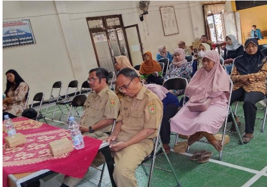
Gambar 2. Pelaku UMKM di Desa Sawitan – Magelang yang Mengikuti Acara Sosialisasi Literasi Keuangan UMKM

Produk Industri Rumah Tangga (PIRT) yang merupakan izin bagi para pelaku UMKM agar dapat menjual segala produk yang dihasilkan secara legal, seperti terlihat pada Gambar 2.