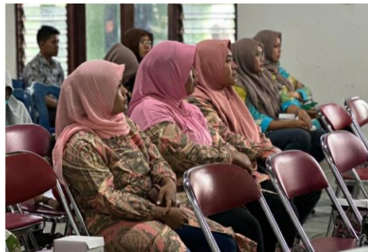
Gambar 2. Penyuluhan Stunting

Pelaksanaan program penyuluhan stunting dilaksanakan di Aula Kelurahan Margomulya, dihadiri oleh peserta: Lurah Margomulya, Perwakilan Puskesmas Seyegan, Perwakilan LPM UMY, Perwakilan DPL KKN, Perwakilan Mahasiswa KKN, warga Padukuhan Sompokan, Ngemplaksari, Jamblangan, dan Jingin dengan jumlah sekitar 30 undangan. Kegiatan penyuluhan stunting diawali dengan pengerjaan pre-test sebagai bahan evaluasi awal terkait dengan pengetahuan peserta mengenai stunting. Pre-test berisi 10 pertanyaan beserta jawaban pilihan ganda dengan kisi-kisi soal berdasarkan materi yang akan disampaikan saat penyuluhan.