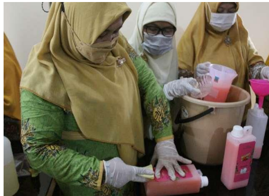
Gambar 3. Praktik Pembuatan Detergen Cair Cuci Piring

Pada praktik pembuatan detergen cair cuci piring dibagi menjadi 3 kelompok yang masing-masing kelompok dipandu oleh fasilitator 1. Dalam simulasi peserta pengabdian masyarakat mempraktikkan cara pembuatan detergen cair cuci piring dengan langkah-langkah menimbang texapon sebanyak 554 g, menimbang NaCl sebanyak 277 g, menimbang asam sitrat sebanyak 50 g, menimbang EDTA sebanyak 5,4 g dilarutkan dalam 20 mL air. Keempat bahan diaduk dengan ditambahkan air sebanyak 2,5 L. Foam booster diukur sebanyak 50 mL, parfum diukur sebanyak 15 mL, dan pewarna ditambahkan sebanyak 20 tetes, gliserin. Produk detergen cair cuci piring dikemas dalam botol kemasan 1 L dan diberi stiker, seperti terlihat pada Gambar 3.