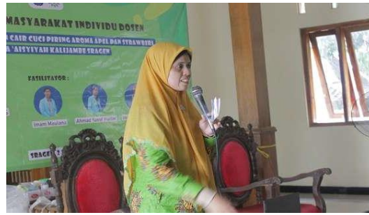
Gambar 2. Ketua Pengabdian Masyarakat Memberikan Pemaparan Materi tentang Bahan-bahan yang digunakan dalam Pembuatan Detergen Cair Cuci Piring