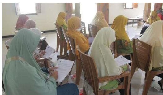
Gambar 1. Peserta Pengabdian Mengisi Soal Pre-Test

Pelatihan dimulai dengan pengisian soal pre-test . Dalam pre-test ini peserta mengisi soal pilihan ganda sebanyak 10 soal yang bertujuan untuk mengetahui kemampuan peserta tentang pengetahuan bahan-bahan yang digunakan dalam pembuatan detergen cair cuci piring, seperti terlihat pada Gambar 1.