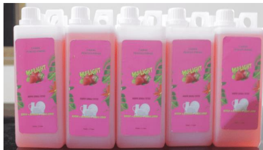
Gambar 6. Produk Pengabdian Masyarakat

Berdasarkan Tabel 2 harga jual detergen cair cuci piring untuk kemasan 1 L adalah Rp14.530,00 sedangkan sebagai pembanding harga jual detergen cair cuci piring di pasaran adalah Rp21.200,00 (kemasan plastik) https://shopee.co.id/search?keyword=sunlight%201%20liter . Produk Pengabdian Masyarakat dapat dilihat pada Gambar 6.