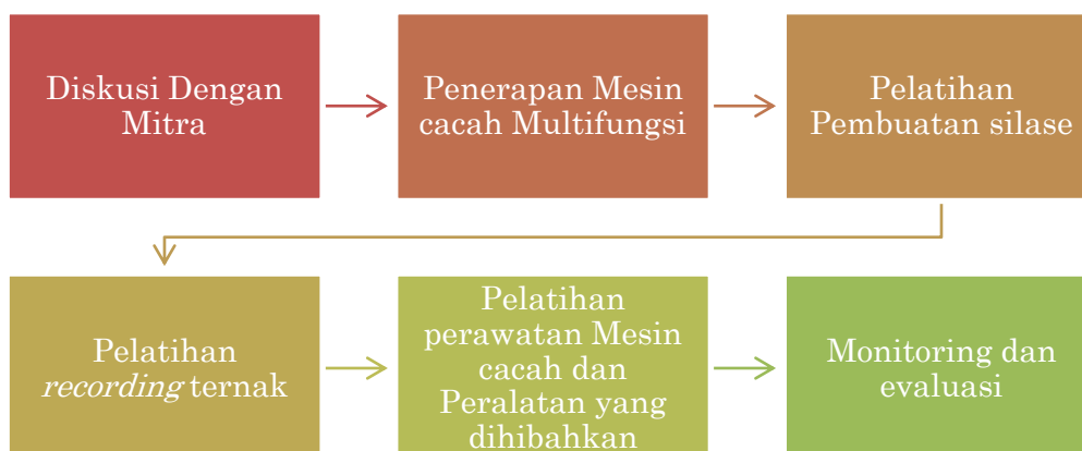
Gambar 1. Alur kegiatan penyelesaian masalah mitra Lereng Mujan

Dalam pelaksanaan kegiatan ini diikuti oleh 5 dosen dengan rincian keahlian berupa 4 dosen teknik mesin dan 1 dosen peternakan. Dalam menyelesaikan tiga masalah yang ada di mitra disusun 6 tahapan kegiatan yang dilaksanakan Gambar 1.