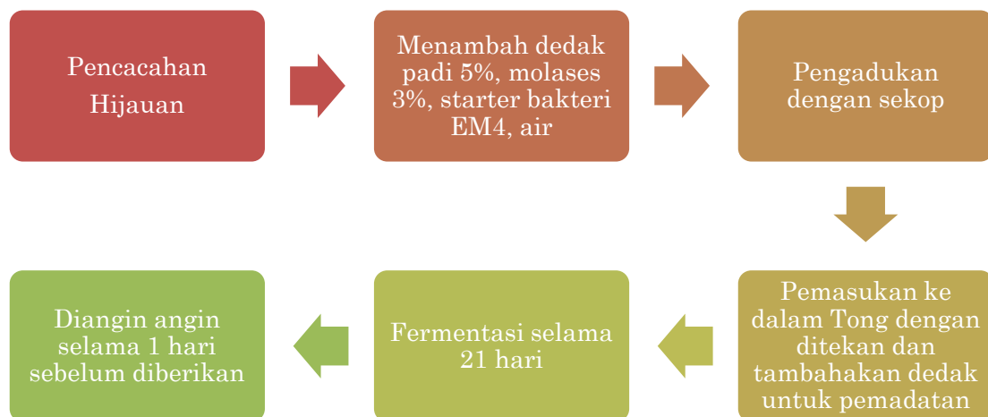
Gambar 3. Langkah Pembuatan Silase

Kelebihan pakan silase, diantaranya: (1) dapat meningkatkan kandungan gizi pakan; (2) mampu menghasilkan bau daun aroma yang disukai sehingga meningkatkan palatabilitas; (3) mampu menghasilkan vitamin; (4) mampu meningkatkan pencernaan; (5) mampu mengurangi parasite saluran pencernaan; dan (6) mampu mengurangi anti nutrisi (Nur Widodo et al., 2022). Dengan kelebihan pakan silase diatas maka dapat meningkatkan bobot domba (Falahudin & Imanudin, 2019). Pakan silase juga dapat digunakan sebagai campuran dengan pakan hijauan. Langkah langkah pembuatan silase perlu dilakukan dengan tepat supaya tingkat keberhasilannya tinggi, langkah pembuatan silase ditampilkan di Gambar 3. Proses pencampuran bahan dasar silase berupa hijauan, ditambah dedak padi, molases, starter bakteri EM4, dan air ditampilkan pada Gambar 4. Proses pencampuran dapat dilakukan dengan tangan kemudian diaduk kembali dengan sekop.