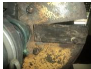
Gambar 8. Perawatan dan pengecekan pisau cacah