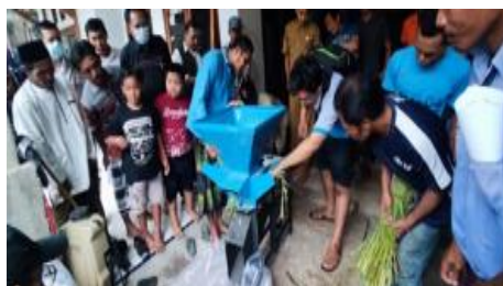
Gambar 7. Pelatihan troubleshooting mesin cacah yang tesumbat