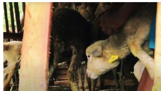
Gambar 6. Pelatihan pemberian neck tag