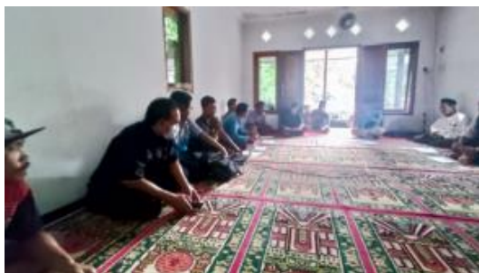
Gambar 5. Pelatihan Recording Ternak