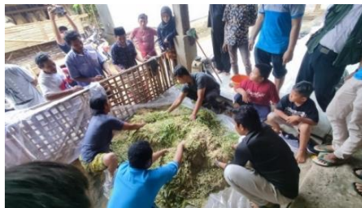
Gambar 4. Pelatihan pembuatan silase tahap pencampuran