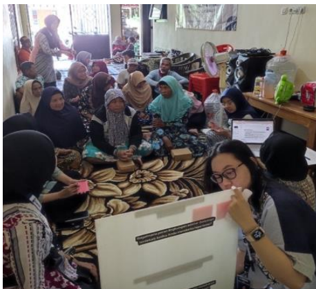
Gambar 1. Kegiatan Pengumpulan Data Primer terkait Permasalahan Hipertensi di Rumah Perangkat Desa Sambiroto

Berdasarkan hasil rangkaian pengumpulan data tersebut, kelompok mencari suatu alternatif solusi yang relevan untuk dijadikan rencana tindakan dengan tujuan untuk menekan angka kejadian hipertensi pada lansia di Desa Sambiroto. “DIMAS MENANTI” atau Demontrasi Masak Menu Sehat Anti Hipertensi merupakan bagian dari suatu program penyuluhan KIE (Komunikasi, Informasi, dan Edukasi) yang dirancang dan dipilih sebagai media edukasi penyuluhan melalui praktik langsung untuk memberikan informasi tentang hipertensi kepada masyarakat sekitar. Agar pelaksanaan berjalan dengan lancar, maka tiga hari sebelum implementasi kami mempersiapkan segala keperluan dan kebutuhan penunjang kegiatan, meliputi pembuatan undangan berupa surat cetak yang dibagikan secara door to door , membeli bahan masakan untuk demo memasak, serta mempersiapkan konsumsi bagi para peserta.