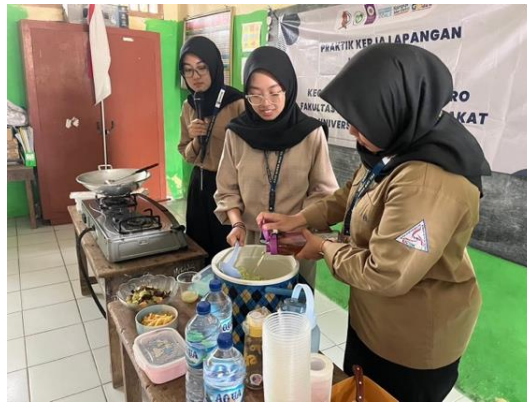
Gambar 2. Kegiatan Demo Memasak Es Timun Serut Salah Satu Menu Sehat Anti Hipertensi