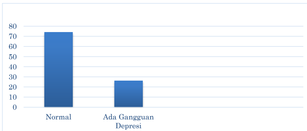
Gambar 4. Evaluasi depresi menggunakan Geriatric Depression Scale (GDS)

Berdasarkan total 35 peserta pengabdian, jumlah peserta yang mengalami hipertensi sebanyak 19 orang (54,3%), sedangkan peserta pengabdian yang tidak dikategorikan hipertensi sebanyak 16 orang (45,7%). Hasil dari pemeriksaan menggunakan GDS dari 35 responden didapatkan bahwa responden yang mengalami gangguan depresi berjumlah 26 orang (74%), sedangkan responden yang tidak memiliki gangguan depresi sebanyak 9 orang (26%). Berikut adalah grafik hasil skrining gejala depresi menggunakan GDS pada peserta pengabdian yang terlihat pada Gambar 4.