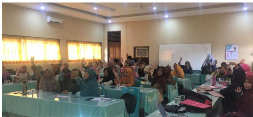
Gambar 2. Respon Peserta Saat Tanya Jawab di Akhir Kegiatan

Selanjutnya, pemateri memaparkan materi hakekat soal kategori HOTS, karakteristik dan fungsinya, serta penjelasan bagaimana menyusun maupun mengembangkan soal kategori HOTS. Kegiatan pemaparan materi juga diselingi dengan proses tanya jawab untuk mempertajam pemahaman peserta. Mengakhiri kegiatan presentasi, instruktur melakukan kegiatan pembimbingan tentang cara mengembangkan soal kategori HOTS. Gambar 2 menunjukkan antusias peserta dalam merespon pertanyaan-pertanyaan instruktur pada sesi akhir pemaparan materi.