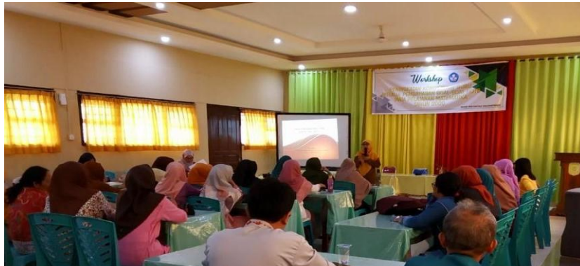
Gambar 1. Pemaparan Materi HOTS oleh Instruktur

mengajukan pertanyaan singkat tentang sejauh mana pengetahuan peserta mengenai soal kategori HOTS. Hasilnya menunjukkan bahwa 45,94% peserta menyatakan kurang memahami, 37,84% peserta menyatakan cukup memahami dan hanya 16,22% peserta yang menyatakan memahami soal kategori HOTS dengan baik.