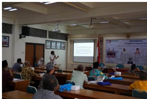
Gambar 1. Suasana Penyuluhan Peningkatan Kompetensi Nadzir

Ada beberapa catatan menarik lainnya dari kegiatan workshop ini yang sejalan dengan hasil berbagai riset tentang pengelolaan wakaf lainnya, diantaranya bahwa pengelolaan wakaf secara produktif mensyaratkan peningkatan pengetahuan para pelaku didalamnya tentang fiqih dan perundang-undangan wakaf ini. Pengelolaan yang baik akan berdampak pada minat masyarakat untuk ikut melakukan syariah satu ini. Wakaf dapat menaikkan perekonomian masyarakat, jika dikelola dengan baik (Nana Alzaina, 2019). Adapun suasana penyampaian materi terlihat pada Gambar 1 dan Gambar 2.