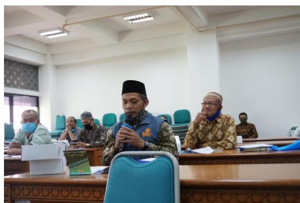
Gambar 2. Sesi Tanya Jawab Penyuluhan Peningkatan Kompetensi Nadzir