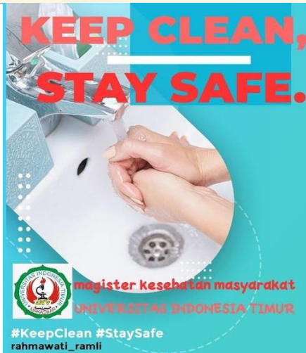
c) Media Informasi Mencuci tangan dengan air mengalir dan sabun