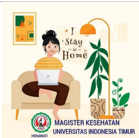
b) Media Informasi Stay At Home