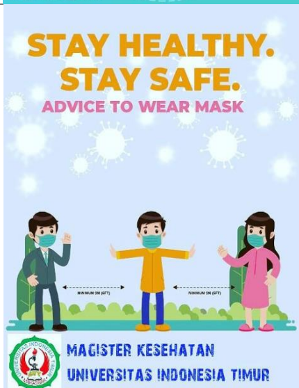
d) Media Informasi Physical Distancing