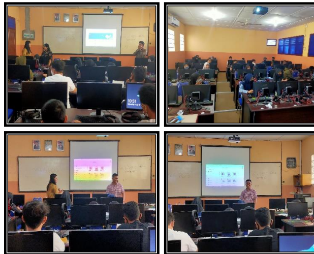
Gambar 2. Pelaksanaan Pendampingan Pelatihan Google classroom

Dalam pemberian materi oleh pelatih (trainer) dilakukan dengan cara terstruktur atau tertata dengan baik, yaitu dimulai dari pengenalan GC serta keunggulan-keunggulannya kepada peserta pelatihan. Pemateri menyampaikan pentingnya pembelajaran secara online apalagi di dalam kondisi pandemic Covid19 yang melanda Indonesia secara khususnya sehingga mutu pendidikan yang diterima oleh siswa tetap berkualitas, yang menjadi salah satu platform yang memberikan concern atau perhatian kepada pendidikan adalah aplikasi GC (Googleclassroom) sebab GC memiliki user interface atau tampilan yang mudah dipahami dan mudah untuk digunakan oleh para siswa dan juga guru, disamping kemudahan itu Google classroom juga memberikan layanan ini secara Cuma-Cuma alias gratis. Dalam praktik yang dilaksanakan dari pengenalan GC, selanjutnya masuk ke tahap pembuatan akun google (email google), selanjutnya mengundang siswa untuk masuk ke kelas yang telah dipersiapkan oleh si pemateri dan mendampingi siswa hingga berhasil masuk ke room kelas yang sudah ditentukan. Tahapan berikutnya adalah memberikan pelatihan cara mengirimkan tugas dan melakukan pengisian presensi online. Dan tahapan terakhir adalah melakukan evaluasi dari materi dan pemahaman siswa terhadap googleclassroom.